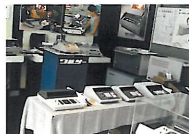
シャープ電子卓上計算機