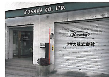
現在の社屋 東区大曽根